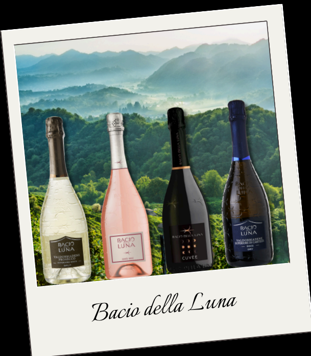
Bacio della Luna