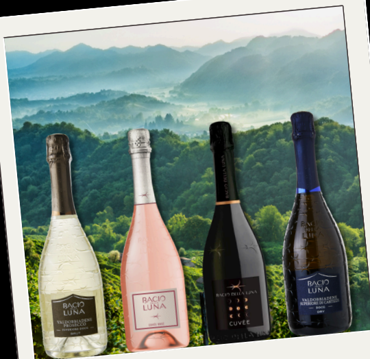
Bacio della Luna