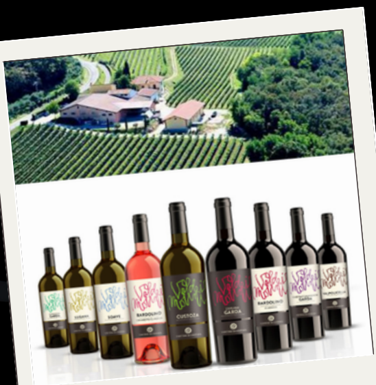
Cantine di Verona

Mais de 50 anos de experiência a serviço dos consumidores em todo o mundo, com o objetivo de levar à mesa apenas os vinhos mais excelentes — capazes de celebrar a singularidade de um território que é o coração pulsante da viticultura italiana: Verona e suas terras maravilhosas, do Valpolicella ao Lago de Garda.