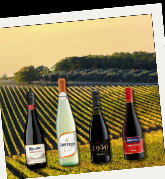
Cantine Riunite & Civ

A Riunite representa paixão, convivialidade, uma cultura de excelência e um profundo respeito pela terra — valores refletidos em cada garrafa excepcional.